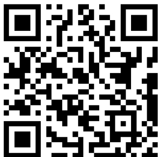
2022“地方财政经济运行”调查问卷